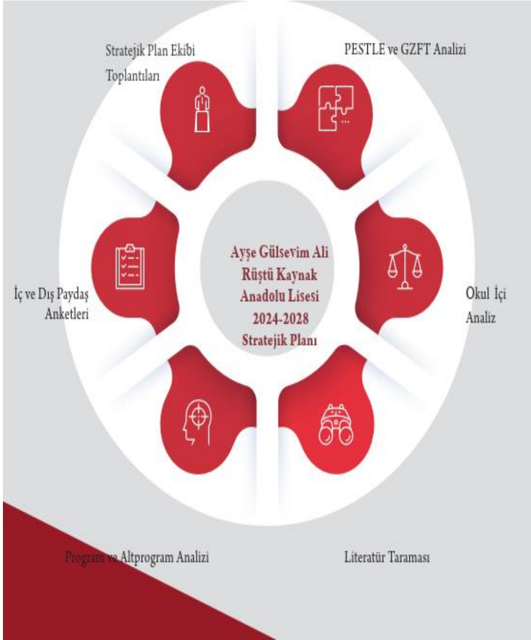
şekil 1.Stratejik Plan Hazırlık Süreci