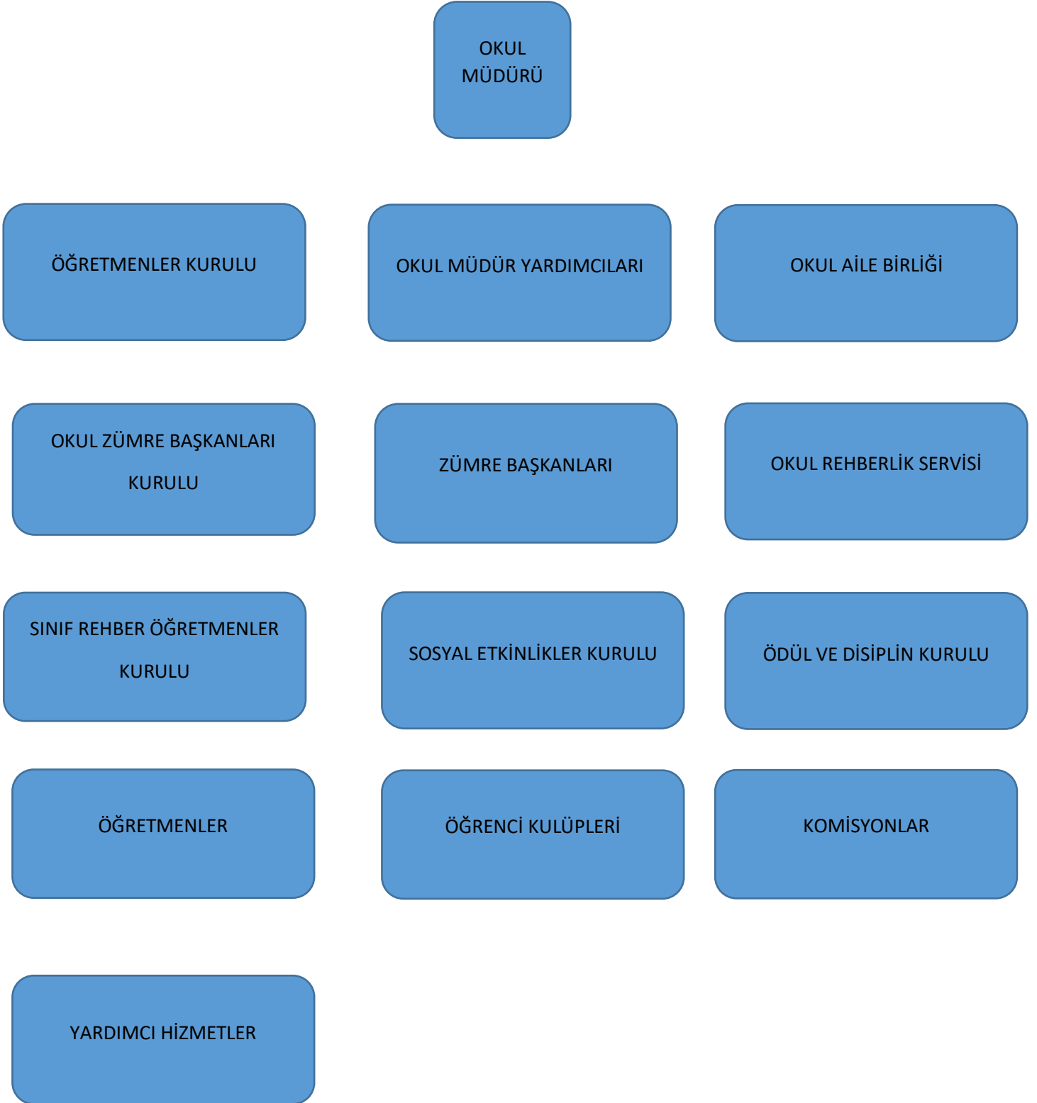
tablo 9 Ayşe Gülsevım Ali Rüştü Kaynak Anadolu Lisesi Teşkilat Şeması